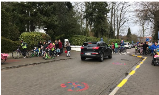
Situatie voor het parkeerverbod

Na de proefprojecten schoolstraat en de bevraging van de ouders, werd er dit jaar in de Kloosterstraat een parkeerverbod ingevoerd aan de linkerzijde ter hoogte van de school. De bedoeling van een parkeerverbod is het verhogen van de veiligheid voor onze kinderen in de directe schoolomgeving. Dit verbod kwam er op vraag van de school aan de gemeente Bierbeek om tegemoet te komen aan het tekort aan parkeerplaatsen voor onze fietsende (groot)ouders. Maar we benadrukken ook graag dat dit een tijdelijke maatregel is, in afwachting van een meer duurzame oplossing en aanpak van de schoolomgeving.