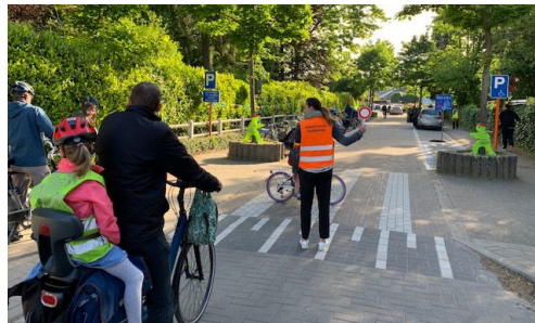
en op de strapdag in september (schoolstraat)