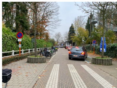
De situatie 's ochtends na het instellen van het parkeerverbod.

Het parkeerverbod biedt een oplossing voor de toename van fietsende ouders.. Wij vragen dan ook om de fietsen zoveel mogelijk op deze parkeerplaats te plaatsen , of op een niet hinderlijke plaats in de buurt (zeker niet vlak naast of tegenover de schoolpoort).